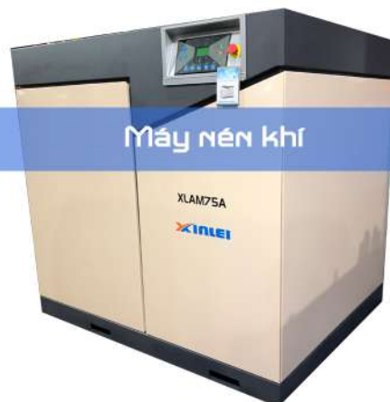
Máy nén khí