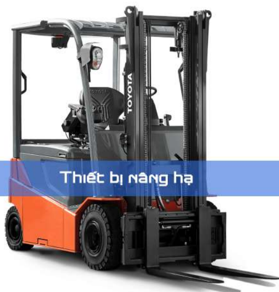
Thiết bị nâng hạ