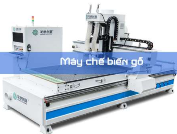
Máy chế biến gỗ